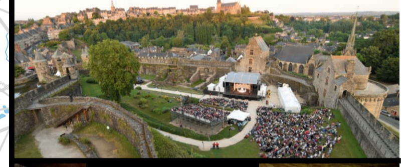
Château de Fougères