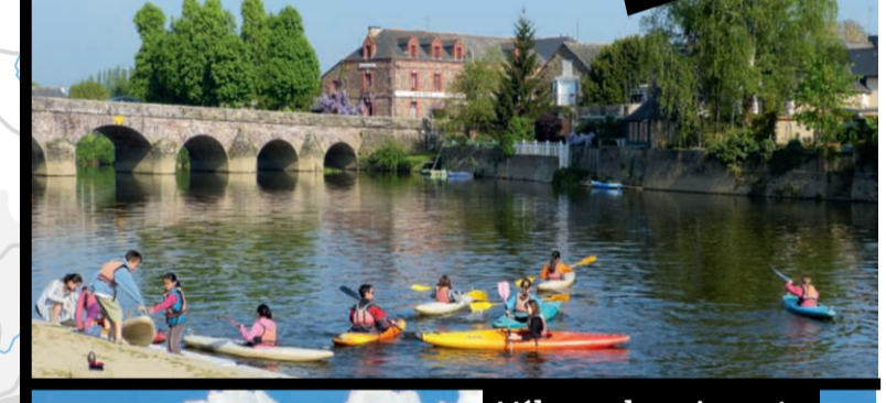
Kayak à La Cale de Pont Réan