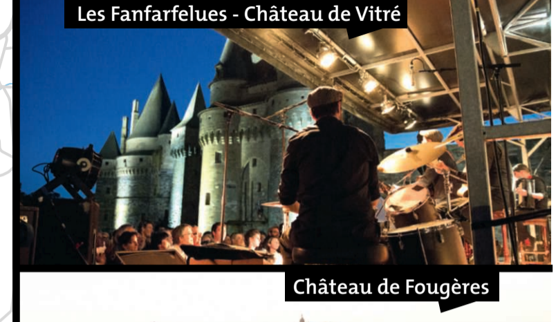
Les Fanfarfelues - Château de Vitré