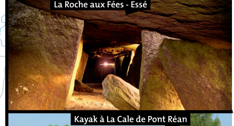
La Roche aux Fées - Essé