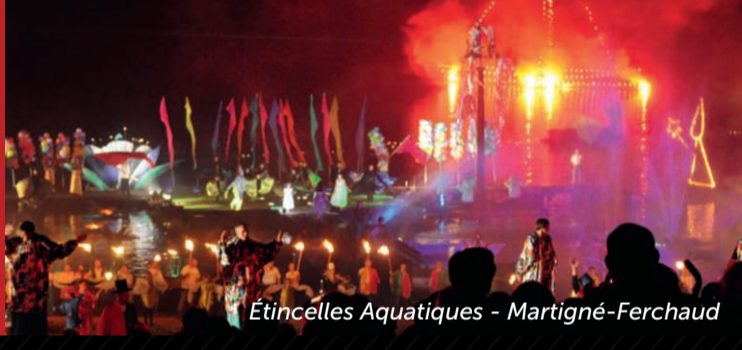
Étincelles Aquatiques - Martigné-Ferchaud

Renseignements et informations sur : lestrans.com festival-mythos.com lestombeesdelanuit.com yaouank.com cirqueoupresque.fr metropole.rennes.fr (Dim. à Rennes) becherel.com etincelles-aquatiques.org lesfanfarfelues.bzh fougeres.fr