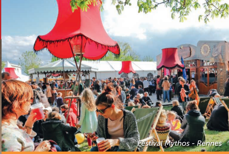
Festival Mythos - Rennes