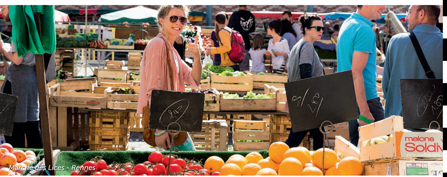
Marché des Lices - Rennes

Assis à une bonne table, au comptoir d'un bar, en plein air, à la fourchette ou à la main... prenez le temps de découvrir notre cuisine selon vos envies !