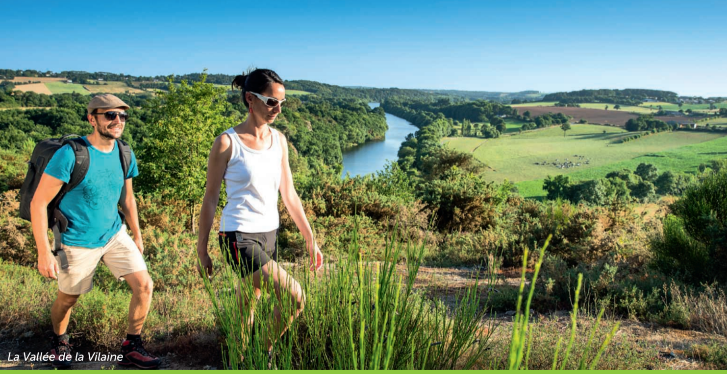
La Vallée de la Vilaine

Forêts accueillantes, vastes étangs, canaux paisibles et vallées encaissées : la Destination Rennes et les Portes de Bretagne se découvre en mode « sport nature » !