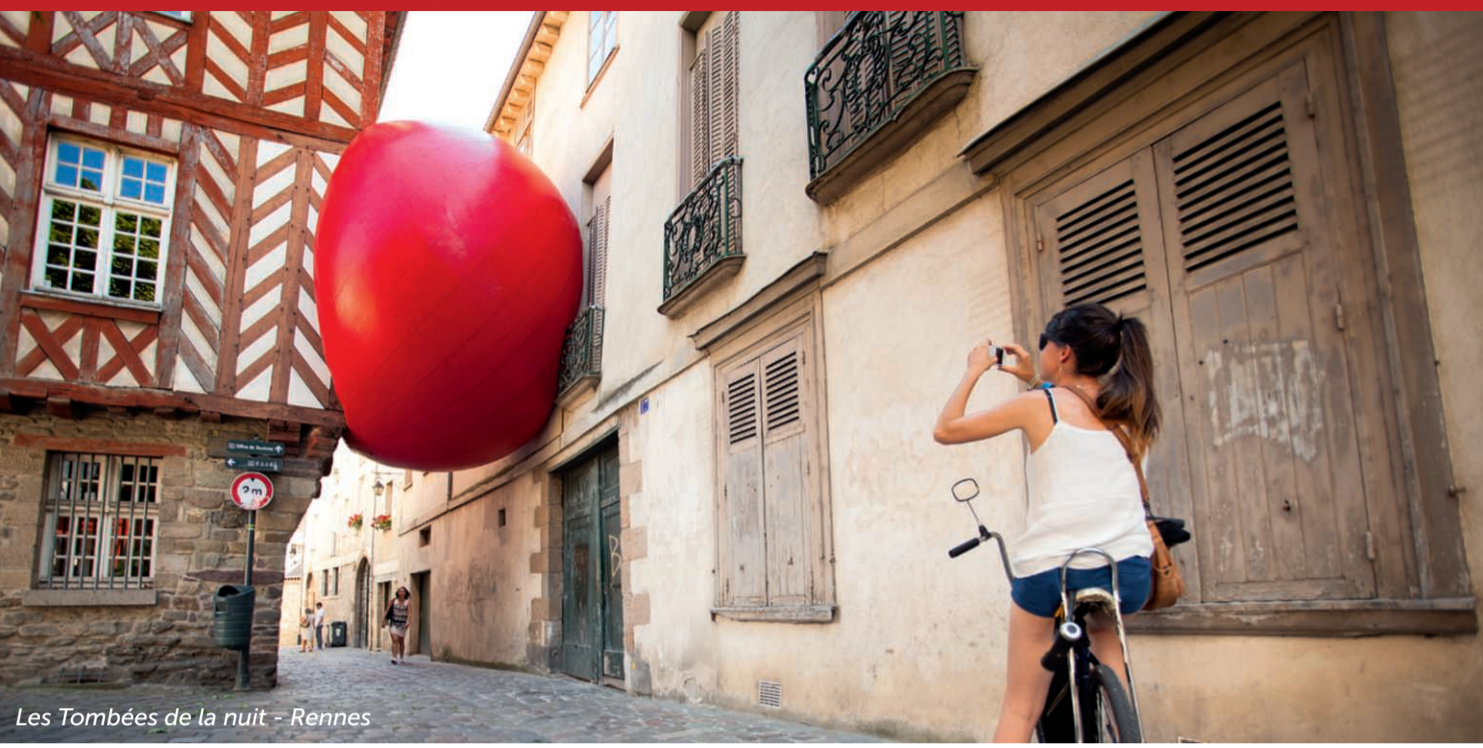
Les Tombées de la nuit - Rennes

La Destination Rennes et les Portes de Bretagne fait la part belle à l'art contemporain !