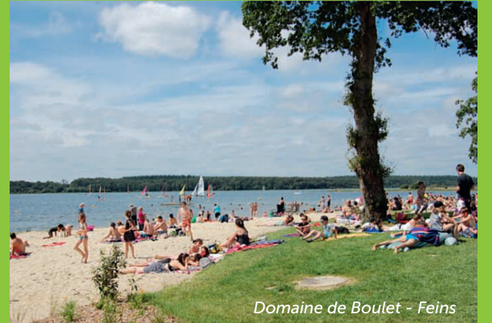
Domaine de Boulet - Feins

Les amateurs de golf seront également comblés : la Destination compte plusieurs parcours de qualité. De quoi faire le plein d'oxygène !