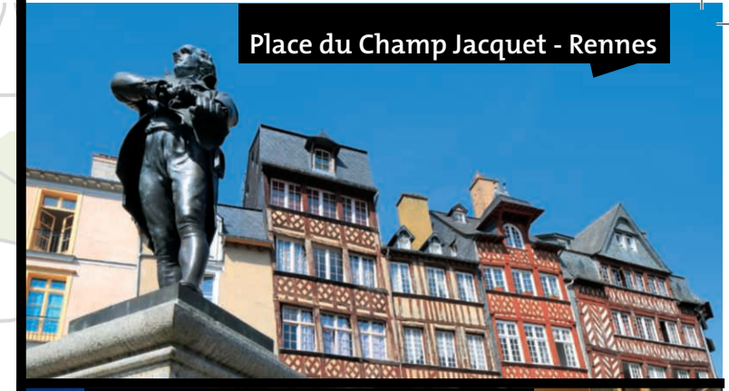
Place du Champ Jacquet - Rennes